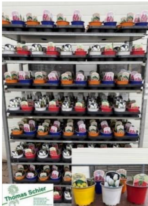
Topfpflanzen auf CC-Containern