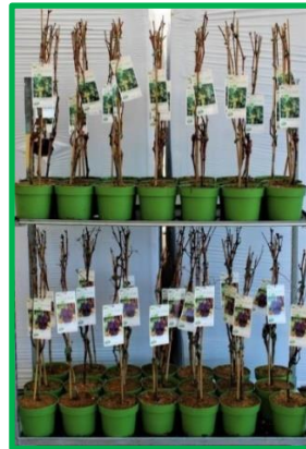
Topfpflanzen und Schalen mit einer Sorte/Farbe je Partie